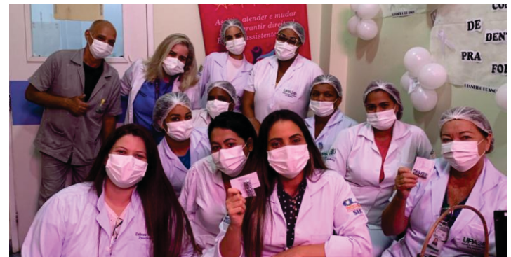
UPA Nova Descoberta