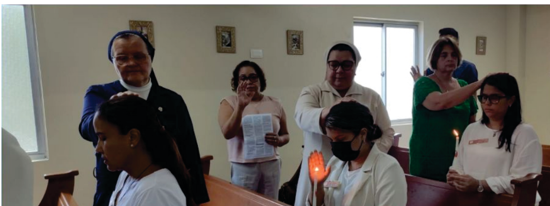
A celebração Eucarística aconteceu na capela do Hospital