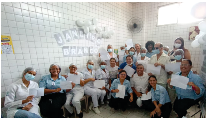
UPA Engenho Velho

No Hospital Ermírio Coutinho (HEC), em Nazaré da Mata, a atividade aconteceu no dia 25, no Posto Central Áurea Azevedo, em parceria com a Secretaria de Saúde Municipal. Na ocasião, profissionais das duas instituições alertaram a população para os cuidados com a saúde mental e emocional, a partir da prevenção decorrentes de estresse, como ansiedade, depressão e pânico. Gestores do Ermírio Coutinho e da prefeitura prestigiaram o evento.