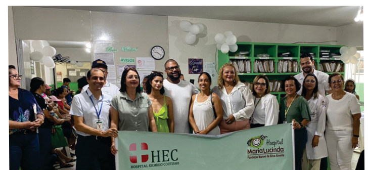
Hospital Ermírio Coutinho