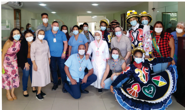
Muitos profissionais entraram no clima do forró