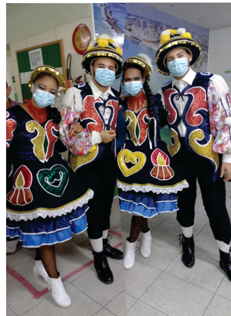
Integrantes da Quadrilha Junina Raio de Sol