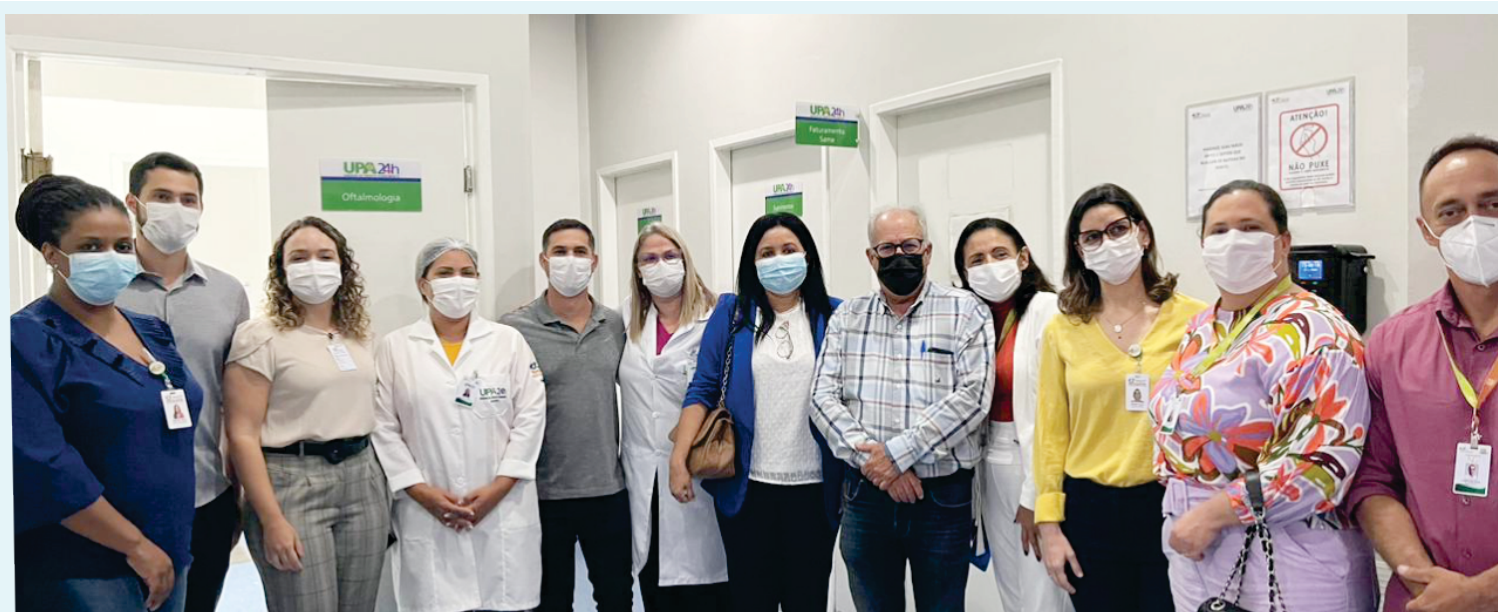
Gestores e profissionais da Fundação Manoel da Silva Almeida/Hospital Maria Lucinda e da UPA Paulista