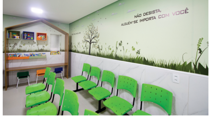
Todos os espaços foram revitalizados