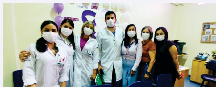
Janeiro Roxo na UPA Nova Descoberta