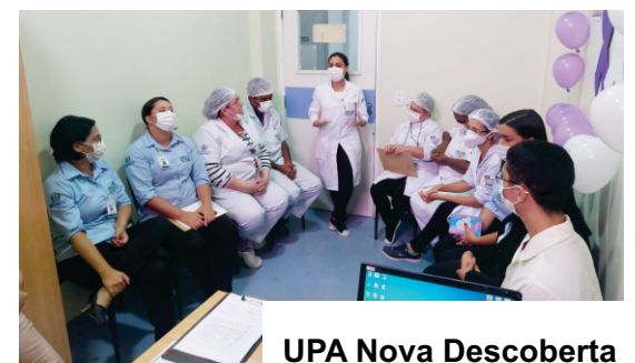
UPA Nova Descoberta